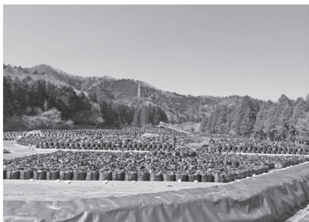
写真2 谷を埋め尽くす除染物を詰めた袋

警戒区域内の放牧場で継続飼養されている牛は土壌よりも汚染レベルの高い自生植物を主食にしており、牛個体の汚染状況は牛群毎に近似しており、放牧しているエリアの山林や牧野の放射能汚染状況を推定できる。耕作されなくなった農地にはセイタカアワダチソウなどが繁茂し、非常に荒れた状態になっていたが、研究会所属農家の農地（放牧場所）は人間が一切管理しなくても農地として良好な状態を保っており（写真3）、牛の放牧によって、高い人件費と作業員の汚染の危険性を犯して行われている除草などの農地管理効果