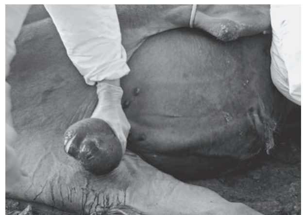
写真1 片側500gの巨大な精巢

研究会では2013年度に、福島原発から北西約11kmに位置する浪江町の小丸共同牧場で、日本草地畜産種