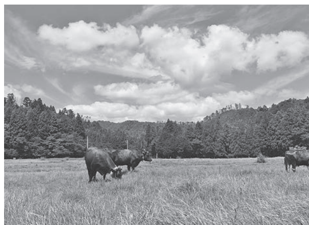
写真3 牛の放牧による耕作放棄地の管理