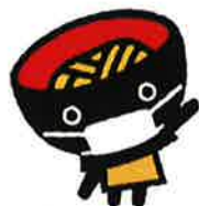
<そばっちゃん(マスクver)>